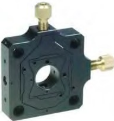
fle.X-plate XY Diff