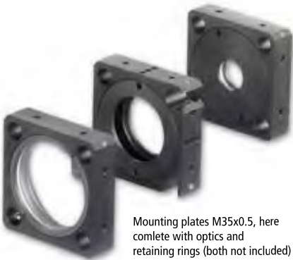
Mounting plates M35x0.5, here complete with optics and retaining rings (both not included)